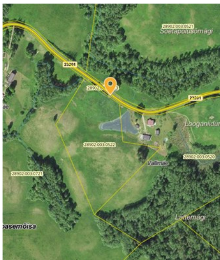
Joonis 1. Riigitee 23201 Puurina-Lüllemäe-Litsmetsa tee km 19,47

Ülaltoodud nõuded on projekti lahutamatu osa, mis kehtivad kaks aastat väljastamise kuupäevast. Tähtaja möödumisel tuleb taotleda uued nõuded.